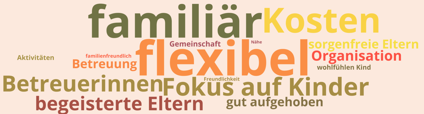
Schriftgröße entspricht der relativen Häufigkeit der Nennungen

Was fällt Ihnen spontan ein, wenn Sie an das Betreuungsangebot durch Tagesmütter bei der Kinderbetreuung Vorarlberg gGmbH denken?