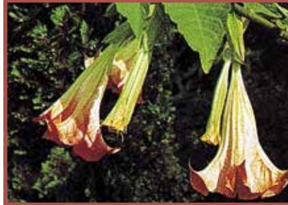
Engelstropete: Alle Pflanzenteile giftig, besonders Wurzeln und Samen.