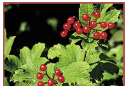
Gemeiner Schneeball: Alle Pflanzenteile giftig.