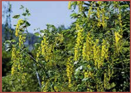
Goldregen: Alle Pflanzenteile giftig, besonders Samen.