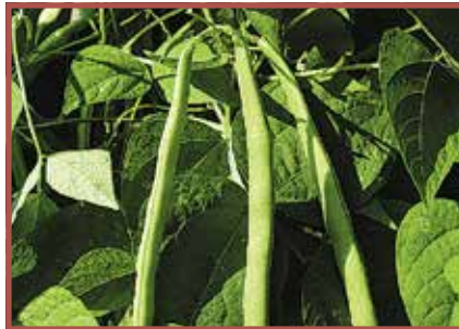
Gartenbohne: Rohe Bohnen stark giftig, gekocht ungiftig.