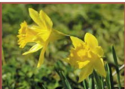
Gelbe Narzisse: Alle Pflanzenteile giftig, besonders die Zwiebel.