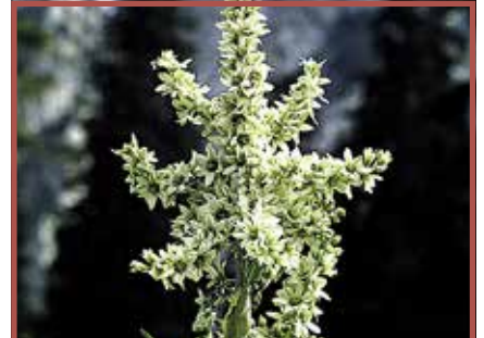
Weißer Germer: Alle Pflanzenteile giftig, besonders Wurzeln.