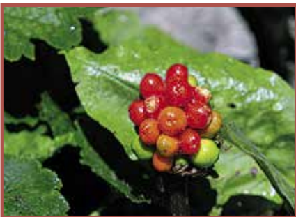
Aronstab: Alle Pflanzenteile giftig.