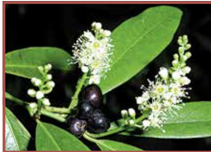
Kirschlorbeer: Alle Pflanzenteile giftig.