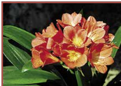
Clivia: Alle Pflanzenteile giftig, besonders der Zwiebelstamm.