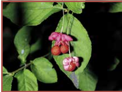
Pfaffenhütchen: Alle Pflanzenteile giftig, besonders Beeren.