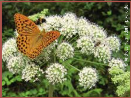
Schierling: Alle Pflanzenteile giftig, besonders Samen.