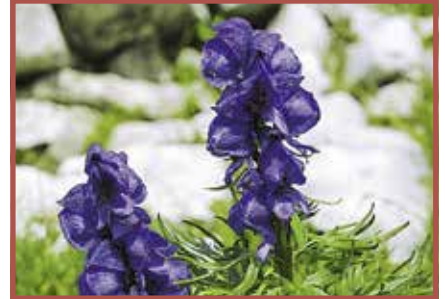
Eisenhut: Alle Pflanzenteile giftig, besonders Wurzeln und Samen, Giftaufnahme auch durch die Haut möglich.