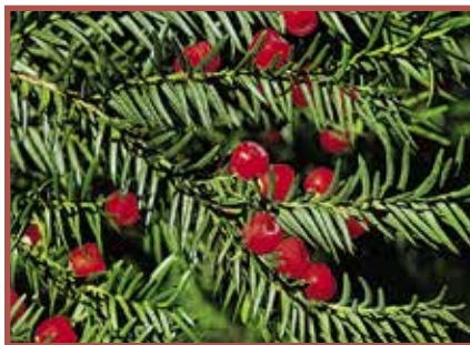
Eibe: Alle Pflanzenteile giftig, besonders das rote Fruchtfleisch.