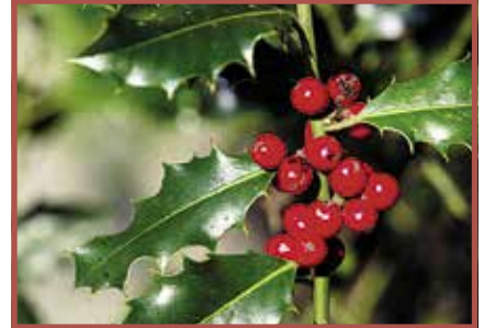
Stechpalme: Blätter und Beeren giftig.