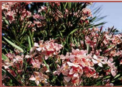
Oleander: Alle Pflanzenteile giftig.