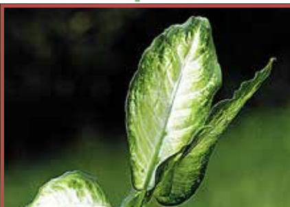
Dieffenbachie: Alle Pflanzenteile giftig, Stamm stark giftig, Saft hautreizend.