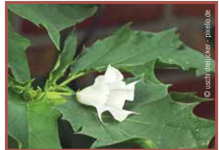
Stechapfel: Alle Pflanzenteile giftig.