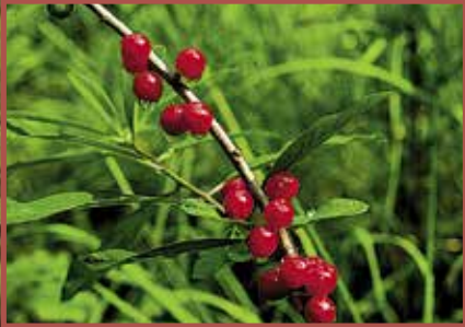
Seidelbast: Alle Pflanzenteile giftig, besonders Beeren und Rinde.