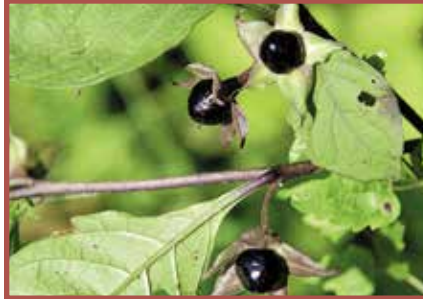
Tollkirsche: Alle Pflanzenteile sehr stark giftig, besonders Beeren, Giftaufnahme auch durch die Haut.