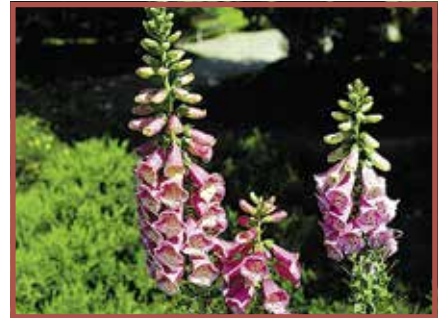
Fingerhut: Alle Pflanzenteile giftig.