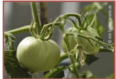
Tomate: Grüne Teile und unreife Früchte giftig.