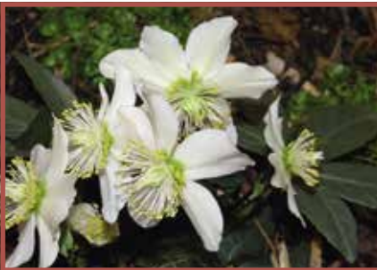
Christrose: Alle Pflanzenteile giftig.