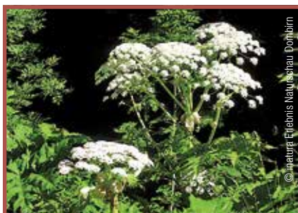
Riesenbärenklau: Alle Pflanzenteile giftig, phototoxische Reaktion bei Sonnenlichteinwirkung.